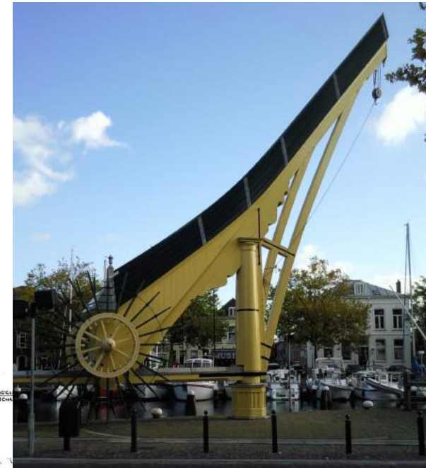
De Stadskraan in Vlaardingen