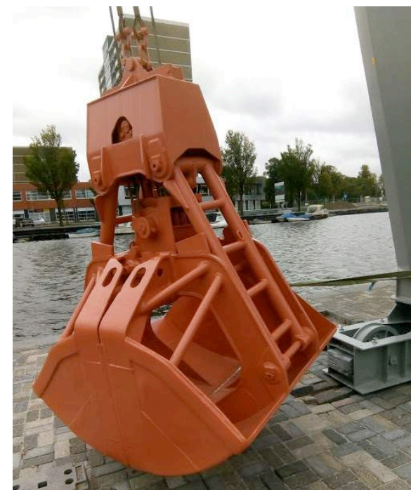
De grijper van de Verhulst kraan op de Calandkade

https://magazineexceptionnel.nl/magazines