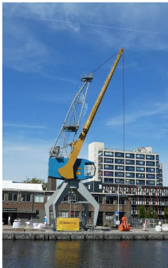
De Verhulst kraan voor het gebouw Maakhaven aan de Calandkade

Mede door de inspanningen van NedSEK zijn de twee Conrad-Stork kranen aan de Laakhaven in Den Haag behouden en, sterker nog, sinds 2018 een gemeentelijk monument.