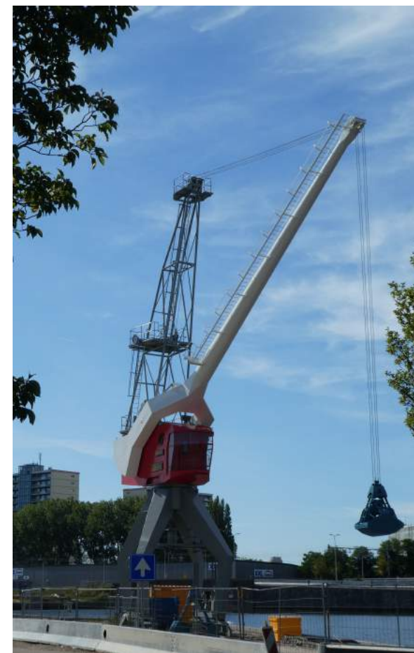
De Fabriton kraan aan de Neherkade

Toen we eind 2015 via SHIE voor het eerst met de kranen kennis maakten en in 2016 voor een eerste oriëntatie de kranen gingen schouwen, vlogen de duiven in en uit, want veel glas zat er niet meer in. Verder zaten er overal wel roestplekken en doorgeroest metaal. Vergeleken bij de kraan