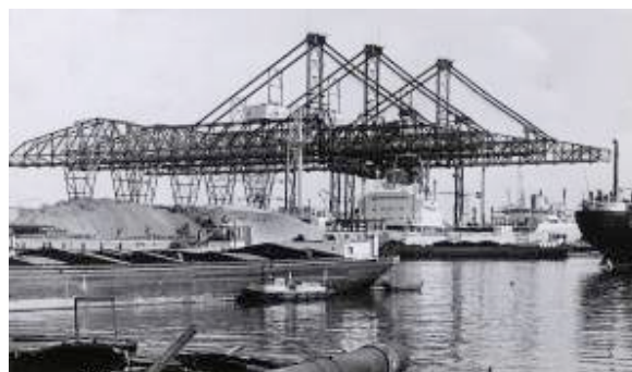
Vulcaanhaven 1958, toen waren er nog drie.

derland is straks voor een groot deel parkeer- en opslagterrein voor het Deense DFDS, het grootste scheepvaartbedrijf van Noord-Europa.