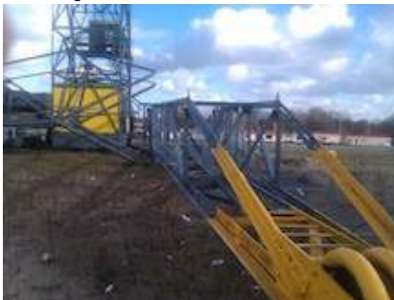
Paard nog even in elkaar zetten

geraamte en het lege machinehuis met de bedieningscabine.