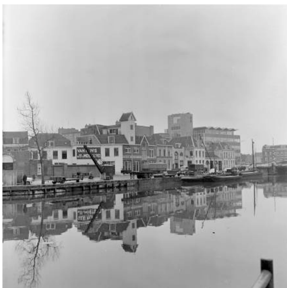
de Nieuwekade omstreeks 1967

Hierboven twee afbeeldingen van dezelfde lokatie met twee eeuwen verschil en vanuit een verschillend standpunt gezien.