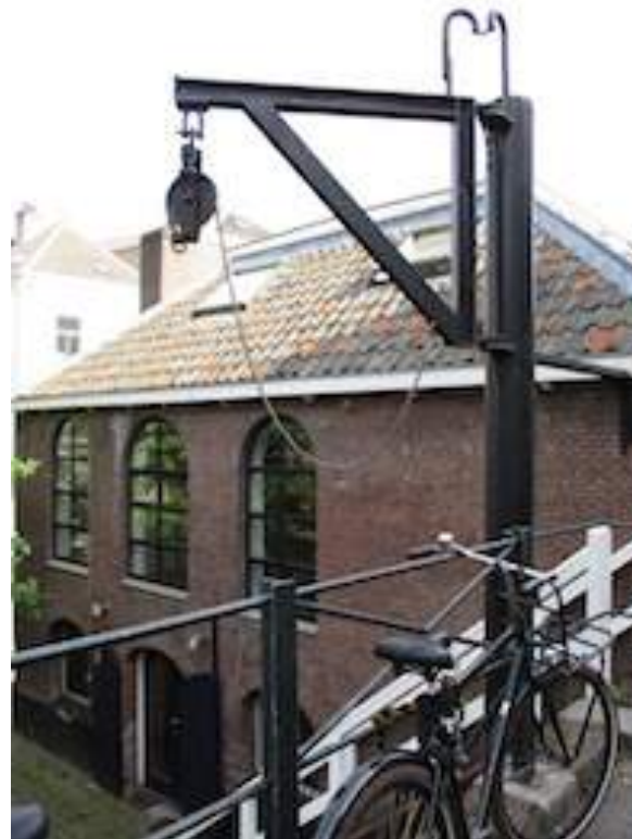
Brouwerij De Boog in 2019

schip afgevoerd werd, moest er ook gehezen worden van de werf naar de straat. En laten we nou net hiervan nog sporen aantreffen: een hijskraan bij brouwerij De Boog, die behouden is en een fotoserie in