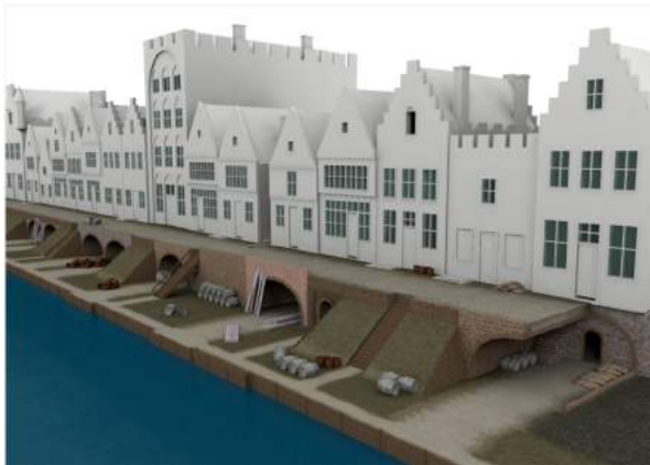
afbeelding uit "Bouwgeschiedenis Utrecht"

Sinds de 12e eeuw liep in Utrecht de route via de Oude Gracht waarlangs onder de koopmanshuizen de goederen werden opgeslagen. Uiteindelijk verbond men de kelders onder de huizen met de werven langs de Oude Gracht.