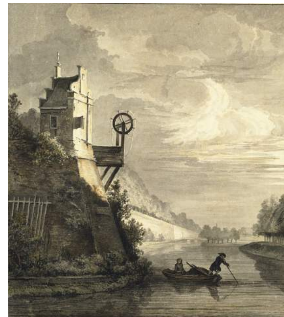
Zonnenburg 1790, fragment. d'Hangest d'Yvoy UtrArch

Onze gedachte was dat langs deze route ook ooit hijswerktuigen gebruikt moesten zijn en oude oude prenten bleek dit ook. Op de Utrechtse Bolwerken werden nadat de verdedigingsfunctie vervallen was op diverse plaatsen hijswerktuigen opgericht.