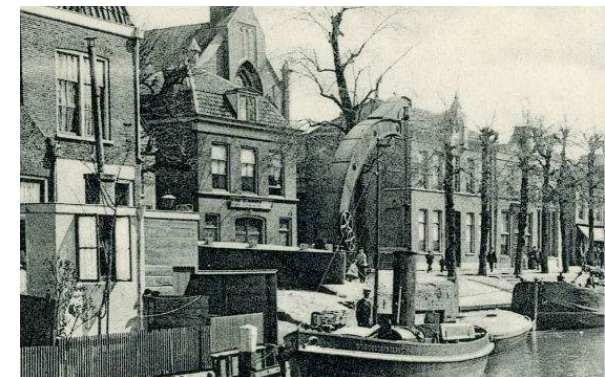
IJzergieterij Utrecht ± 1935, de Oud-Katholieke kerk er achter staat er nog steeds!

lets van deze industrie was ook zichtbaar net voorbij de Weerdsuis aan de Vecht bij de Bemuurde Weerd 56 waar een Fairbairnkraan van IJzergieterij Utrecht stond.