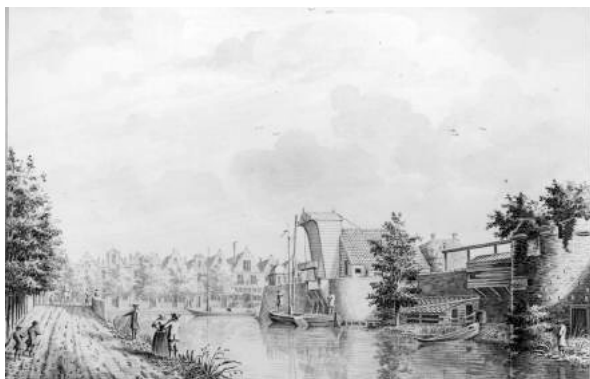
Heftoren Het Paard omstreeks 1760