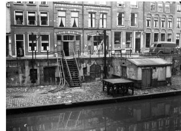
Utrechtste Bierhandel ± 1935

het Utrechts Archief van de Utrechtse Bierhandel op Oudegracht 285-287, waar behoudens de keurig gerestaureerde gevelpuien alle sporen gewist zijn. Zo komen we vanuit de ambachtelijke periode in onze ge-industrialiseerde tijd.